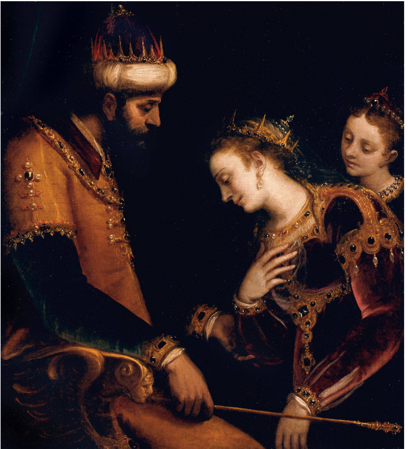
Luca Cambiaso, Esther and Ahasuerus , circa 1569, 38 3/4 x 34 13/16 in., oil on canvas. Blanton Museum of Art, The University of Texas at Austin, The Suida-Manning Collection, 2017.964